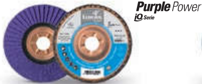
V4 Purple Power iQ Serie