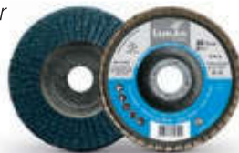
V4 Master iQ Serie