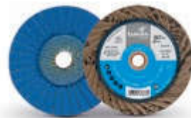
SLTflex iQ Serie