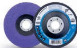
Purple Grain iQ Serie