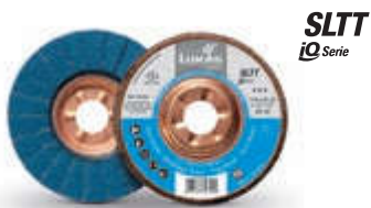
SLTT iQ Serie

Unter dem Familiennamen „iQ-Serie“ bündeln wir Werkzeuge unserer High-Performance-Linie. Mitglieder dieser Familie sind zum Beispiel Schleiflamellenteller, die durch ihre patentierte Lamellenform und -anordnung das Schleifen auf höchstem Niveau gewährleisten.