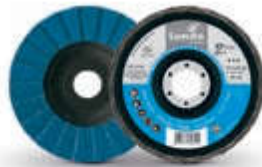
V2 Power iQ Serie